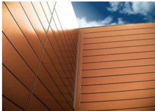
Incobends Daezl Nave Ind. Beniparrel (Val.)