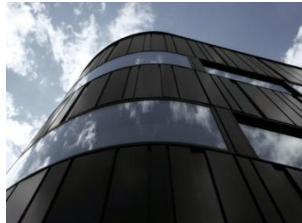
Incobends Letezl Oficinas Sueca (Valencia)